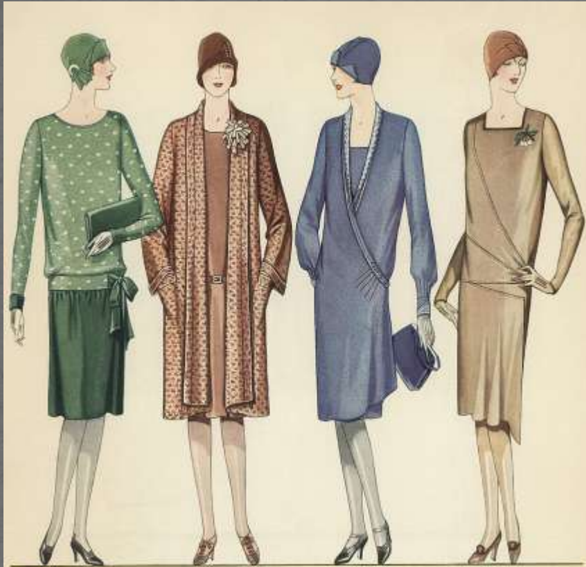
McCall's August 1925