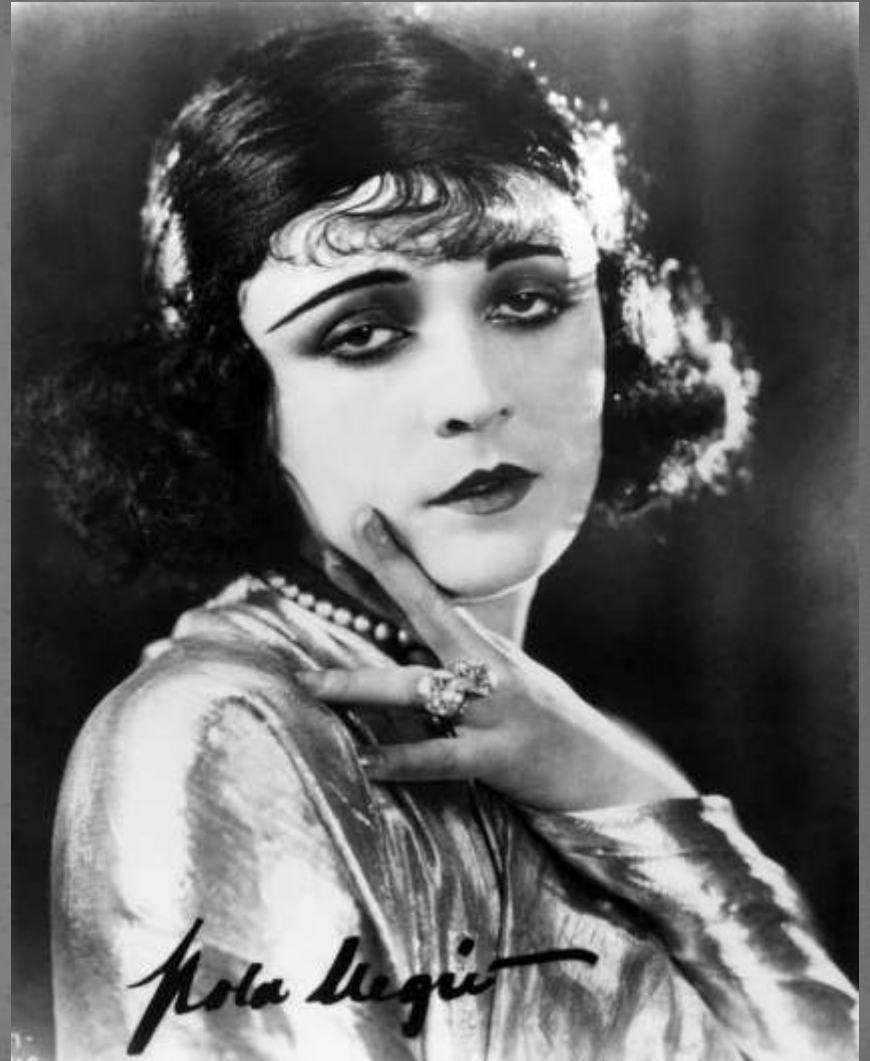
Pola Negri ok. 1922 roku