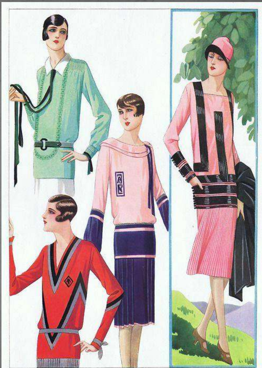
la femme chic Sup. N° 208. Pl. 428.