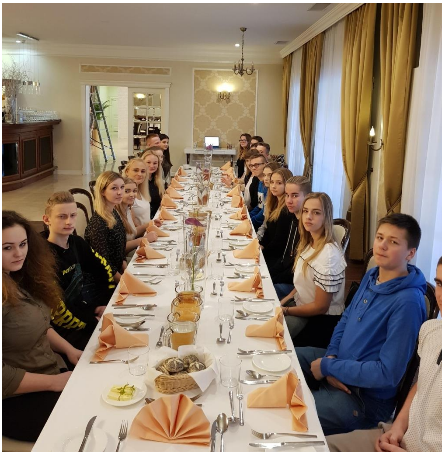
Klasa 1i przy stole.

Tak wyglądał nakryty stół na naszego obiadu, który składał się z 4 dań: przystawki, zupy, drugiego dania i pysznego deseru.