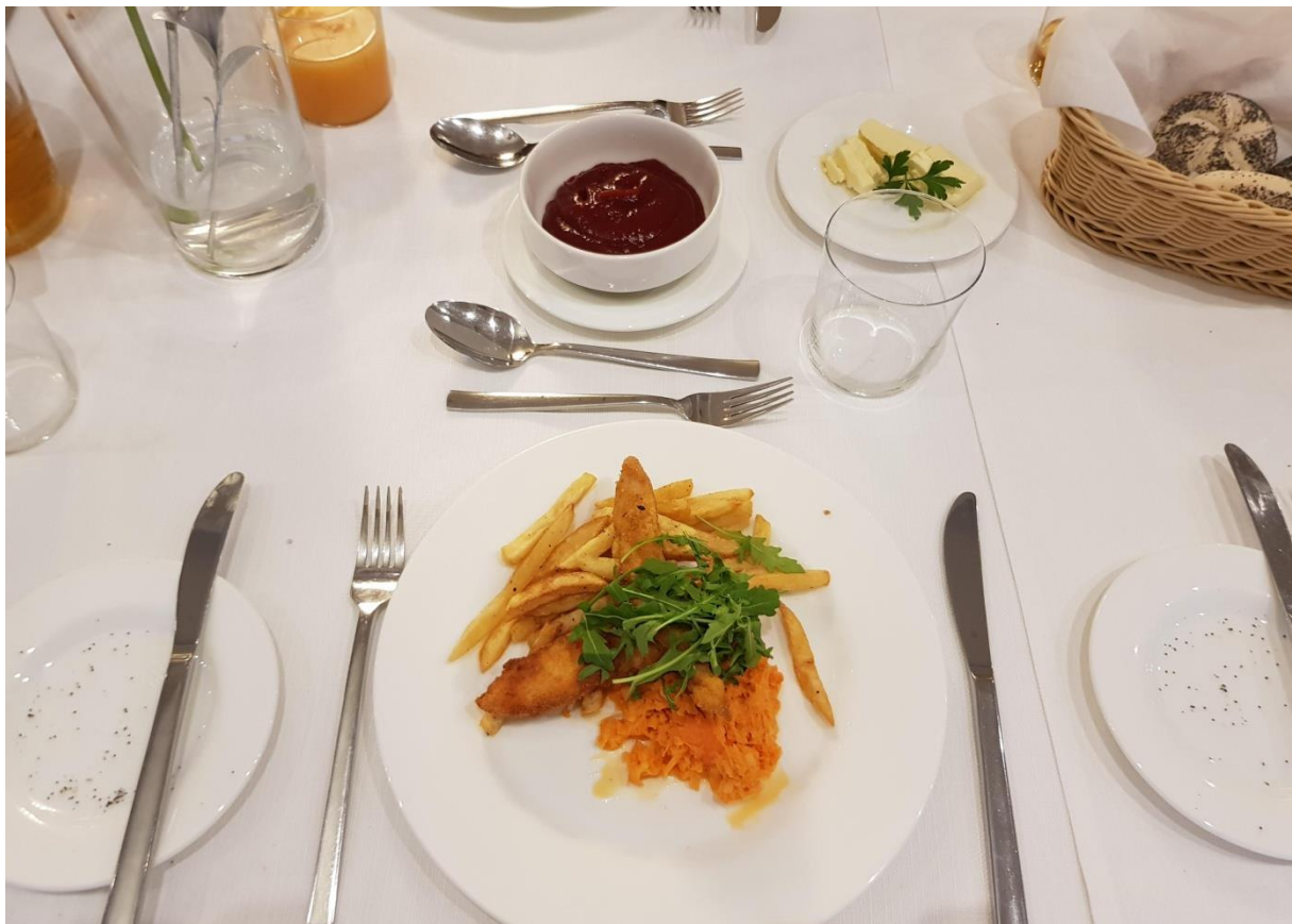
To nasze główne danie .....